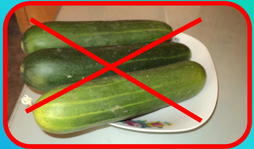
သခွားသီး