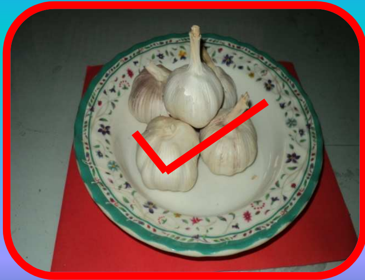
ကြက်သွန်ဖြူ