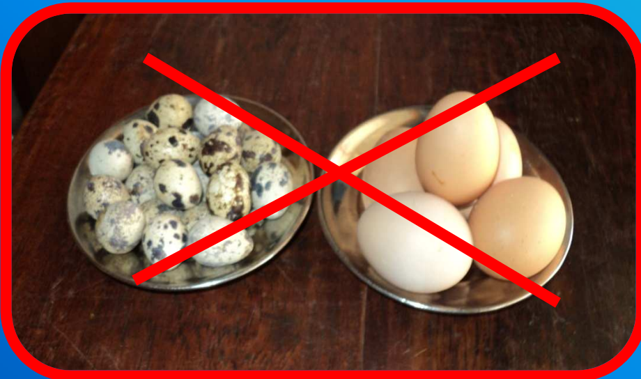
ပဲခူး၊ ကြက်ဥ