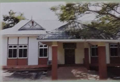
တိုင်းရင်းစားပညာ ငြိတိုက်