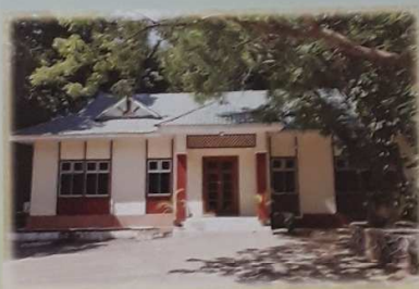
စာမျိုးသားဝရင်ဆေးရုံနှင့် ဝင်ရောင်လင်းဆောင်