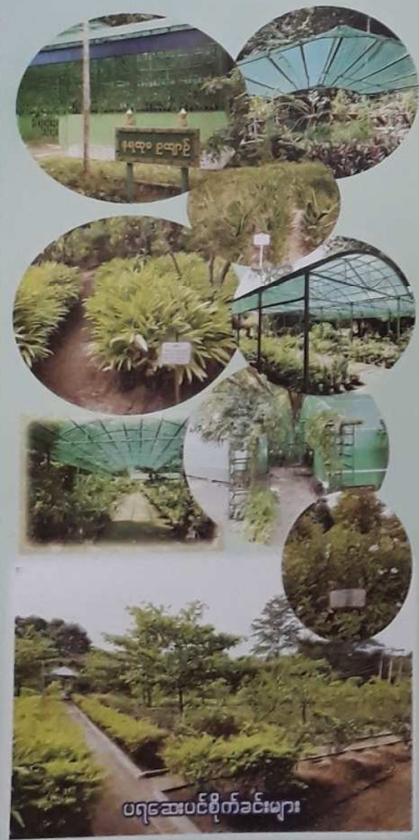
ပရင်ဆယ်ပင်စိုက်ခင်းများ