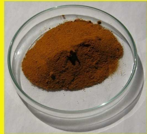
နန္ဒင်းမှုန့်