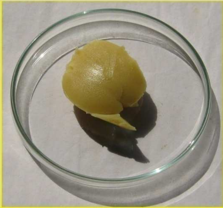
ဖယောင်းဖြူ