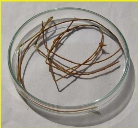
ဂရင်ဂျီကြိုး