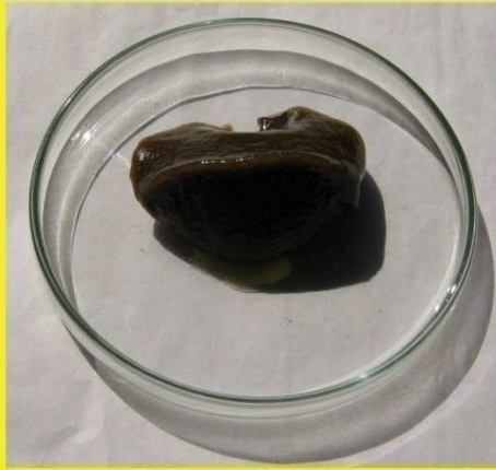
ဖယောင်းညို