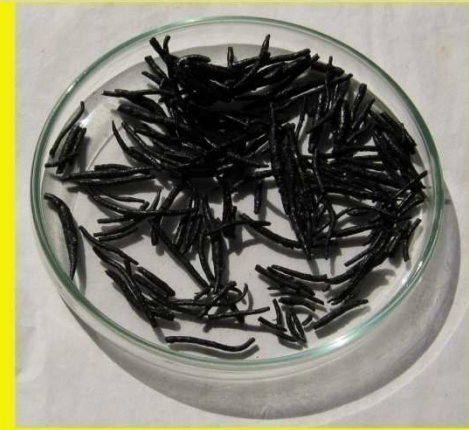
ဂရင်ဂျီဆေးတောင့်