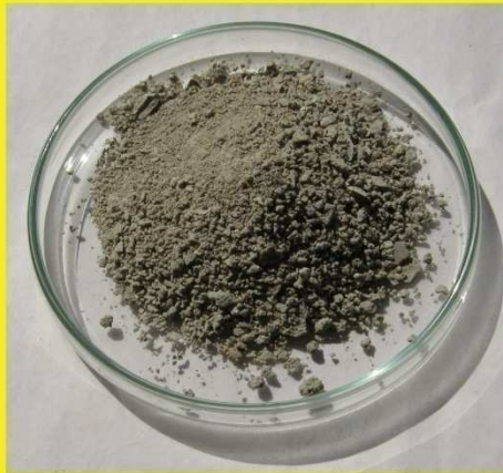
ရုက္ခမူဆား